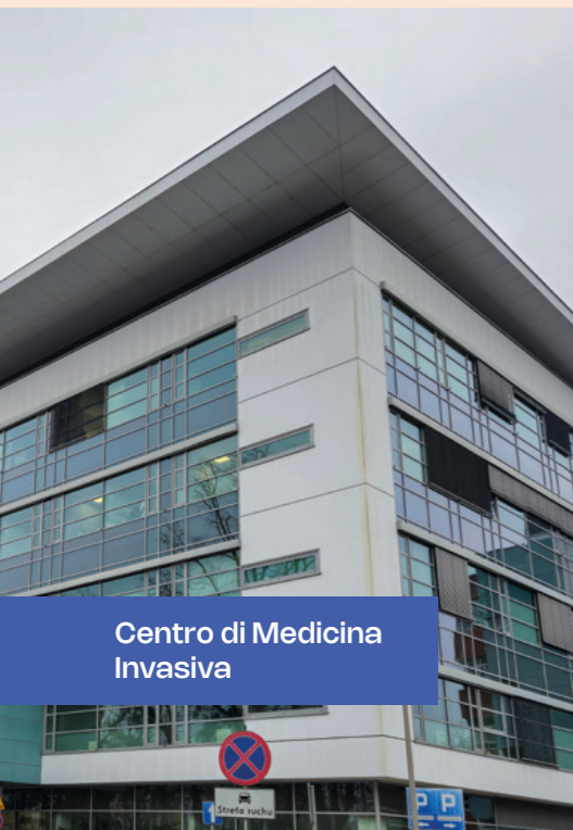
Centro di Medicina Invasiva

Le Università Fahrenheit costituiscono la più grande alleanza accademica della Polonia settentrionale, che riunisce l'Università Medica di Danzica, il Politecnico di Danzica e l'Università di Danzica. Oltre 4.000 docenti offrono formazione in quasi 170 corsi di studio. Unisciti a più di 40.000 studenti e scegli il tuo percorso!