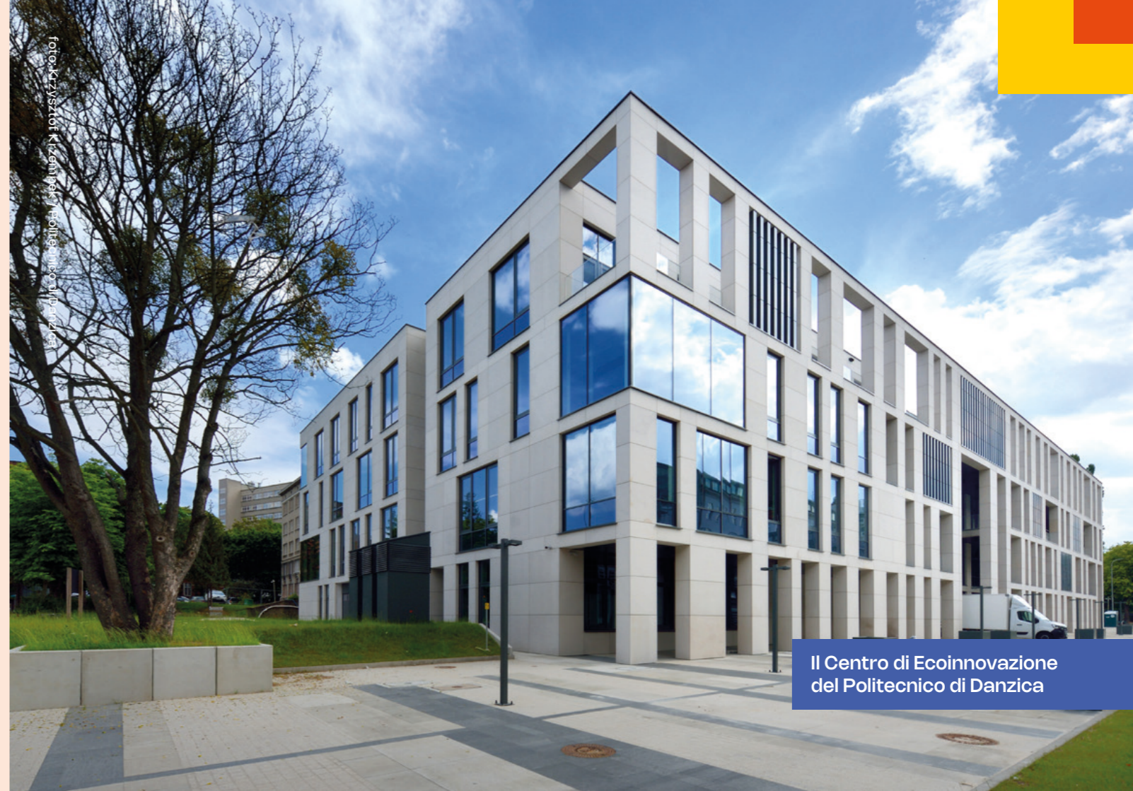
Il Centro di Ecoinnovazione del Politecnico di Danzica

Il Centro Offshore opera nei moderni laboratori dell'Università Marittima di Gdynia e ti offre l'opportunità di testare tecnologie, dispositivi e simulatori innovativi utilizzati nell'industria offshore. Qui puoi condurre ricerche personali, acquisire esperienza pratica e collaborare con esperti del settore. È un'ottima occasione per fare il primo passo nella tua carriera.