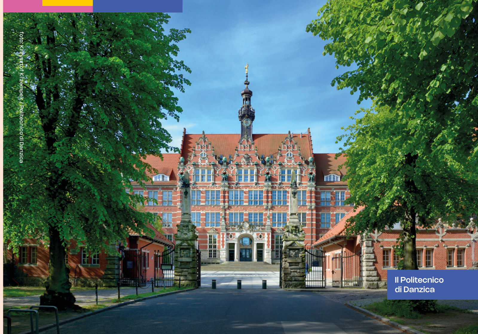
Il Politecnico di Danzica

L'Università Medica di Danzica è uno dei principali atenei medici della Polonia, riconosciuto sia a livello nazionale che internazionale. L'università unisce un'ottantennale tradizione a un approccio moderno alla formazione. Grazie all'eccellente corpo accademico e a un'infrastruttura all'avanguardia, GUMed svolge attività scientifica, clinica e di ricerca specialistica di livello mondiale, contribuendo allo sviluppo della scienza medica globale.